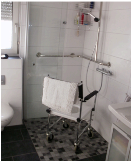
Nach dem Umbau: