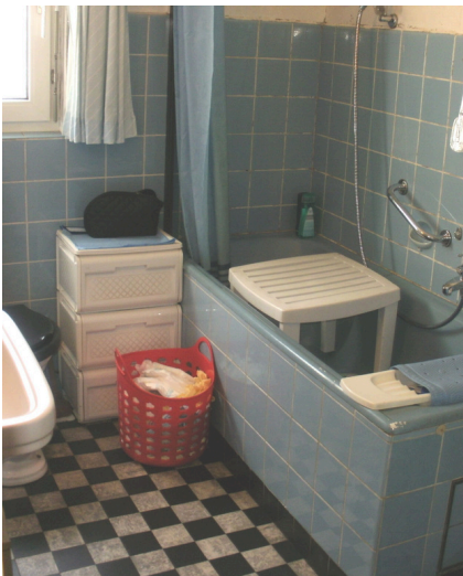
Vor dem Umbau: